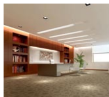
ICBC Development Center Beijing R&D Department 中国工商银行软件 开发中心北京研发部 (内装修)工程 [在施工程]