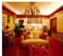
Hohhot EAST SHORE 内蒙古自治区 呼和浩特市东岸国际别墅 精装修工程