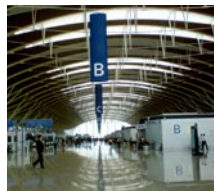
Beijing Capital International Airport Terminal 3 首都国际机场 T3-C航站楼维保项目