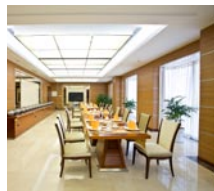
Chang An Rong fu 长安融府办公楼内装修工程